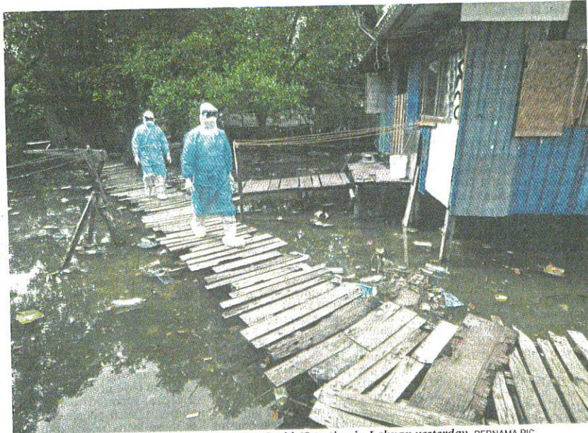
Health officers on their way to conduct mass Covid-19 testing in Labuan yesterday.

Selangor registered the second highest number of local transmissions at 50, followed by Penang (33), Labuan (19), Perak (nine), Kuala Lumpur (eight), Kedah (seven), Johor (five), Melaka (three) and Putrajaya (two), while Negri Sembilan and Pahang recorded one new case each.